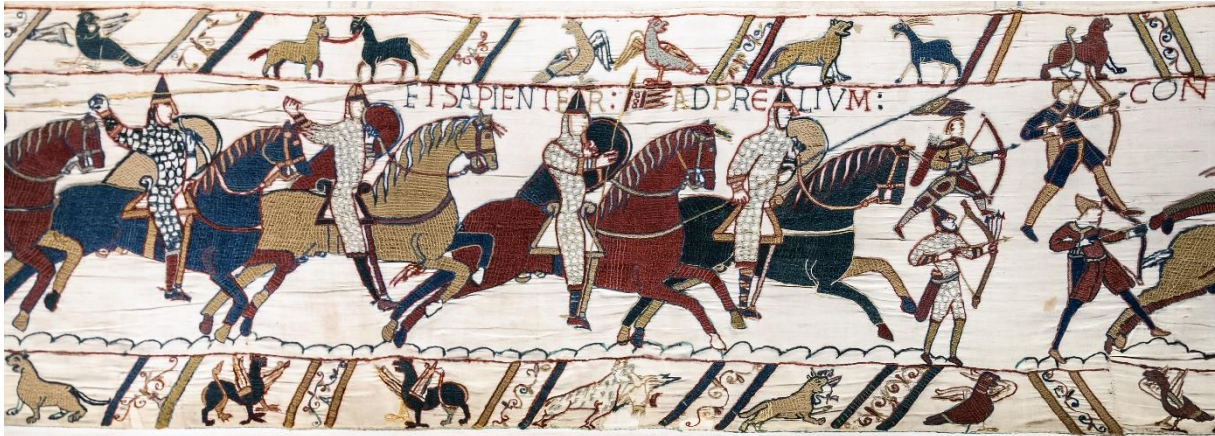
Afb. 1 Een elfde-eeuws strijdtoneel. Fragment van het Tapijt van Bayeux (circa 1070-1077).